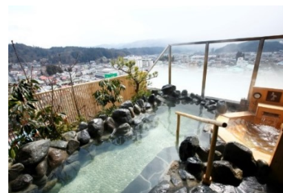
最上階の展望露天風呂