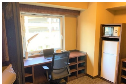
備え付けの家電(一例)