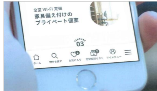
<ナビゲーションを設置>

「志望校周辺の住まいをどのように探せば良いかわからない」、「遠方から内見に行くのは交通費も時間もかかる」、「コロナ禍で都市圏に行くのが不安」などのお声をもとに、親御様と学生様の目線に立ち、サイトを構築いたしました。サイト内のコンテンツには現在生活をしているご入居者様のインタビュー記事や寮長・寮母の紹介記事に加え、進学・住まい選びに役立つ情報を充実させました。また、チャットボットを導入し、短時間で疑問を解決できる機能もご用意いたしました。