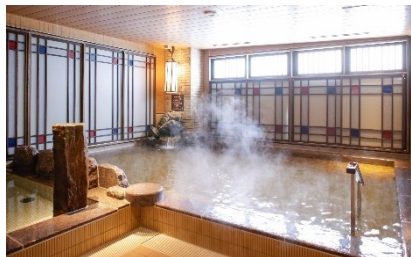
最上階の天然温泉大浴場

『ドミーイン神戸元町』公式WEBサイト: https://www.hotespa.net/hotels/kobemotomachi/