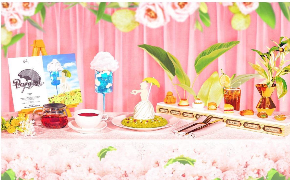
クロード・モネの「散歩、日傘をさす女性」をモチーフにした『パラソル(Parasol)』

東京の躍動感や波長と共鳴し、五感を魅了する数々のこだわりでお客さまをお迎えする『 メズム東京、オートグラフ コレクション 』(運営: JR 東日本グループ・日本ホテル㈱代表取締役社長 里見雅行/総支配人 生沼久)は、名画をモチーフにした大好評のアフタヌーンティー『アフタヌーン・エキシビジョン』の第5弾として、印象派を代表するフランスの画家クロード・モネの代表作「散歩、日傘をさす女性(Woman with a Parasol)」の世界観を表現した『パラソル(Parasol)』を、16階のバー&ラウンジ「ウイスク」にて2022年3月1日(火)～6月30日(木)の期間、平日15食限定で提供いたします。