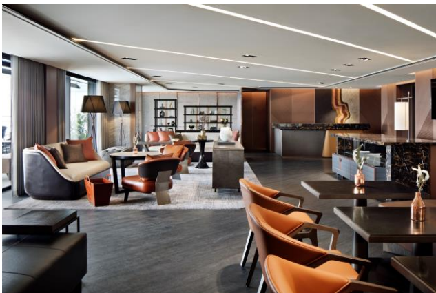
クラブラウンジ「クラブメズム」