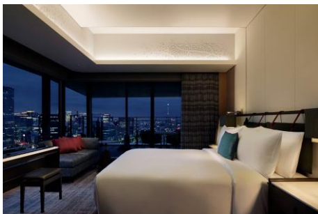
チャプター3 スイート / 95 m 2