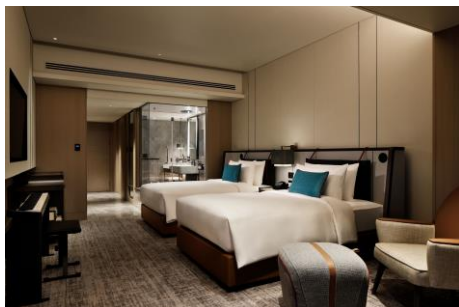
チャプター1 / 40 m 2

メズム東京の全 265 の客室は、スタイリッシュかつクリエイティブな内装で統一され、浜離宮恩賜庭園側に位置するゲストルームでは、開放的なバルコニーから壮観な東京ベイエリアと緑豊かな日本庭園の美しいコントラストをお楽しみいただけます。40～44 m 2 と使い心地のいい広さでビジネスにもレジャーにも最適な「チャプター1」及び「チャプター2」、95 m 2 の広さを誇り東京の摩天楼と豊かなアーバンネイチャーを独り占めできる「チャプター3 スイート」、そしてホテル最上階の 26 階に位置する 180 m 2 の最上級のラグジュアリー空間「チャプター4 スイート リュクス」など、くつろぎとインスピレーションが同居する様々なタイプのゲストルームをご用意しております。客室内には、日本のクラフトマンシップに通じる注目のブランド企業とのコラボレーションによるオリジナルアメニティとなる THE BLEND シリーズをご用意しているほか、コンパクトでありながらスマートなデザインとグランドピアノのような豊かな音色を再現するカシオ計算機の高機能デジタルピアノ「プリヴィア」を設置するなど、遊び心にあふれたアイテムでお客さまをお迎えいたします。