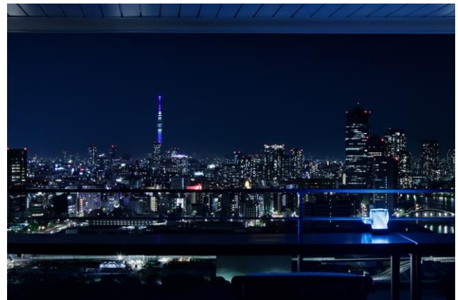
クラブラウンジ「クラブメズム」からの眺め