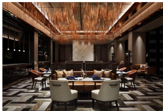
シェフズ・シアター