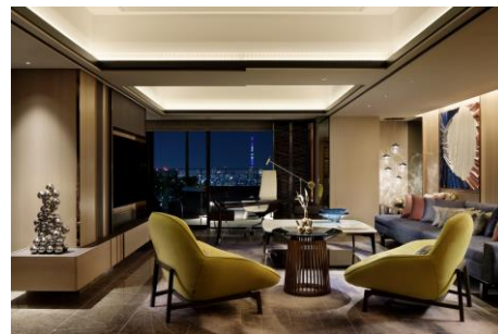
チャプター4 スイート リュクス / 180 m 2