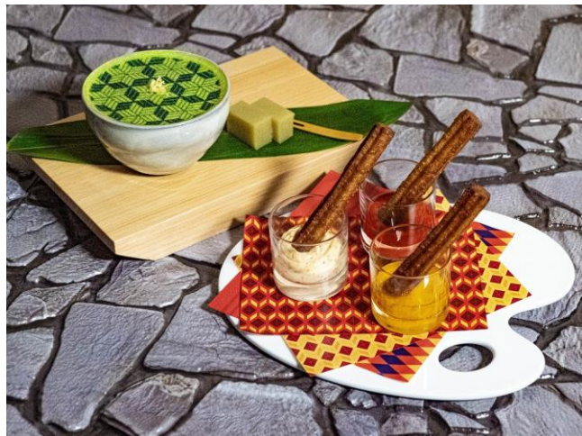
チュロス3種と自家製芋ようかん

【チョコソース】 カカオ66%のフローラルな香りのビターチョコレートを使用した上品な甘さが癖になる味わいです。