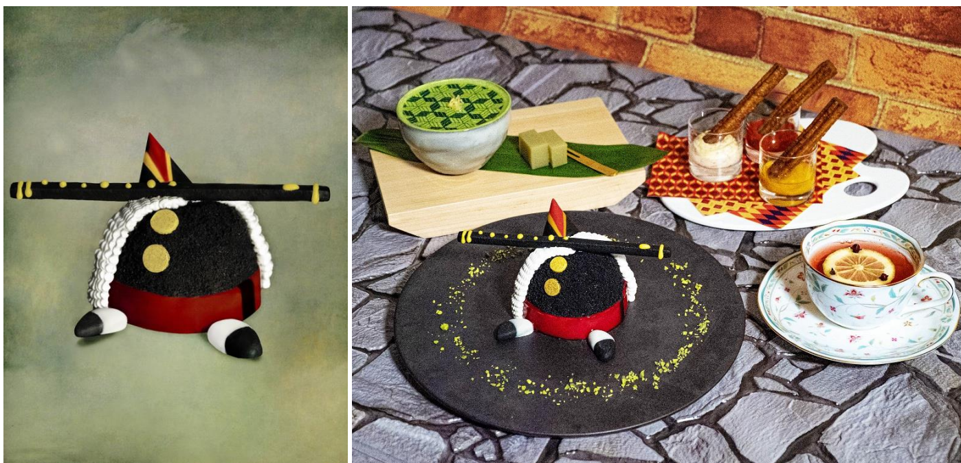
画家エドゥアール・マネの「笛を吹く少年」をモチーフにした『ファイアー (Fifer)』(左:メインのケーキ、右:全品)

東京の“今”の躍動感や波長と共鳴し、五感を魅了する数々のこだわりでお客さまをお迎えするホテル『 メズム東京、オートグラフコレクション 』(運営:JR東日本グループ・日本ホテル㈱代表取締役社長里見雅行/総支配人人生沼久)は、有名絵画をモチーフに、遊び心あるスイーツとペアリングモクテルをセットにした大好評の新感覚アフタヌーンティー『アフタヌーン・エキシビション』の新作として、19世紀のフランスの画家エドゥアール・マネの代表作のひとつ「 笛を吹く少年 」の世界観を表現した『ファイアー (Fifer)』を、16階のバー & ラウンジ「ウイスク」にて2021年11月1日(月)～2月28日(月)の期間、平日15食限定で提供いたします。