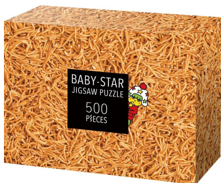
『ベビースター』ジグソーパズル