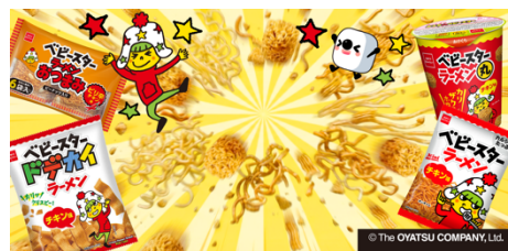
『ベビースター』コラボプロフィール背景