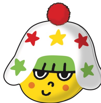
ホシオくんクッション