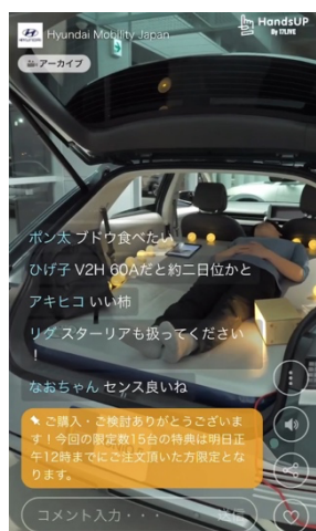
第1回目の配信画面

2022年10月13日(木)に行われた「Hyundai IONIQ5 ライブショッピング」第1回目のライブコマースでは、直営拠点「Hyundai Customer Experience Center 横浜」を舞台に、電気自動車「IONIQ 5」の紹介および販売を実施。