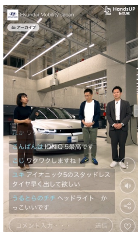
第1回目の配信画面

2023年1月14日(土)に実施する「インポートカーオブザイヤー受賞 IONIQ 5 ライブショッピング」では、2022年7月にオープンした日本国内初の直営拠点「Hyundai Customer Experience Center 横浜」を舞台に、昨年12月にインポートカーオブザイヤーを受賞した電気自動車「IONIQ 5」の紹介および販売を行います。