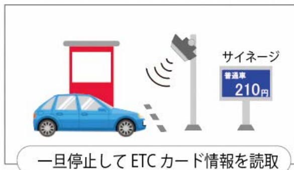
E T C 読取イメージ

■本件に関するお問い合わせ先 ※別紙3「社会実験における実施体制」をご参照ください。