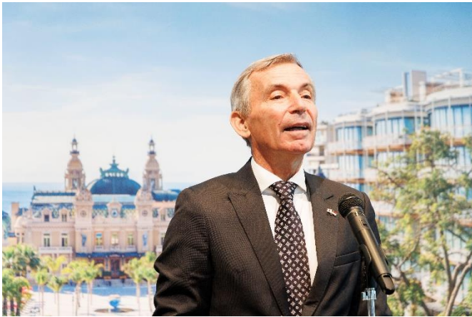
ディディエ・ガメルダンジェモナコ公国大使 乾杯スピーチ

1 部の各プレゼンテーションでは皆様に真剣に耳を傾けていただき、2 部ではレセプション会場に場所を移し、モナコ産オーガニックリキュールのカクテルや、ブルガリホテルの三ツ星シェフが監修するコンテンポラリーイタリアンのビュッフェをお楽しみいただきました。また、AS モナコ所属、大活躍中のサッカー日本代表 南野拓実選手から届いたビデオレターのご紹介や、モナコの 5 つ星ホテルの宿泊券や南野選手のサイン入りユニフォームが当たるラッキードロウ抽選会を実施し、会場は大いに盛り上がりました。