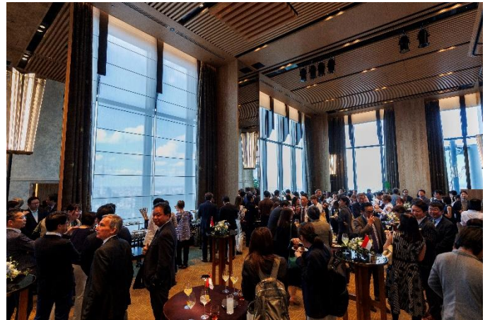
歓談時の会場の様子