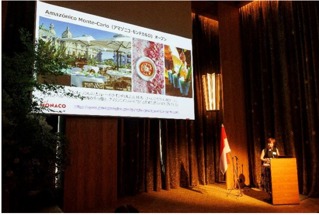
モナコ政府観光会議局 プレゼンテーションの様子