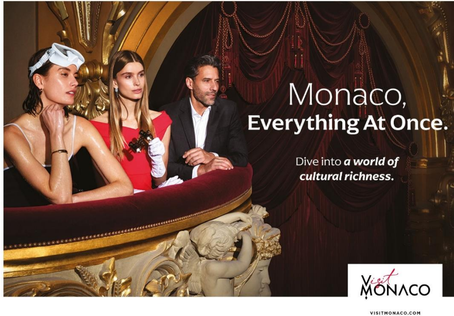
新キャンペーン〈Monaco, Everything At Once. (全てが叶う国、モナコ)〉キャンペーンビジュアル

モナコ政府観光会議局（所在地：モナコ公国）は、本月より新たな広報キャンペーン〈Monaco, Everything At Once. (全てが叶う国、モナコ)〉を開始しました。本キャンペーンは、グローバルで展開され、旅行者に対する認知度と目的地としての魅力の向上を目的としています。