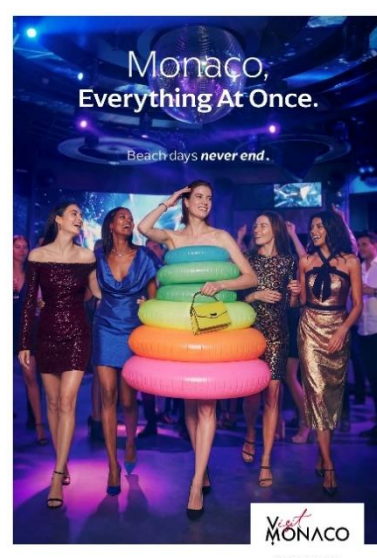
全 6 種類の新キャンペーン<Monaco, Everything At Once. (全てが叶う国、モナコ)>キャンペーンビジュアル