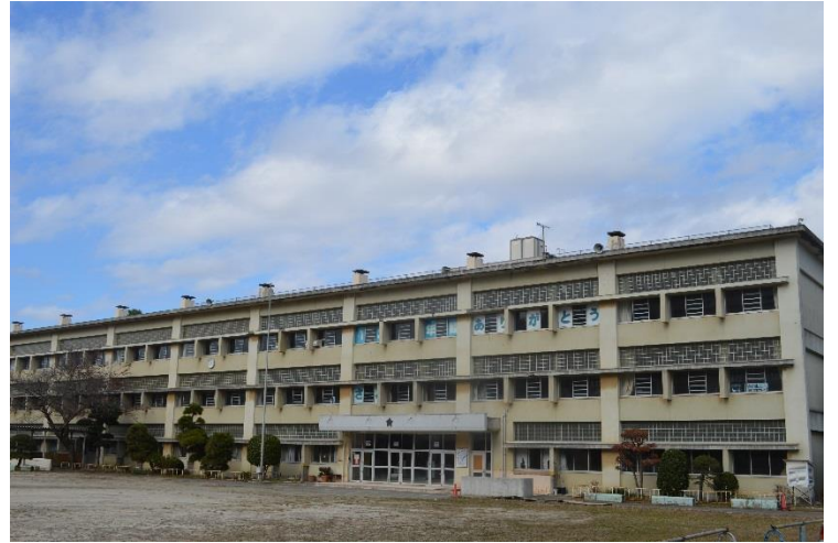
【旧大貫小学校校舎】