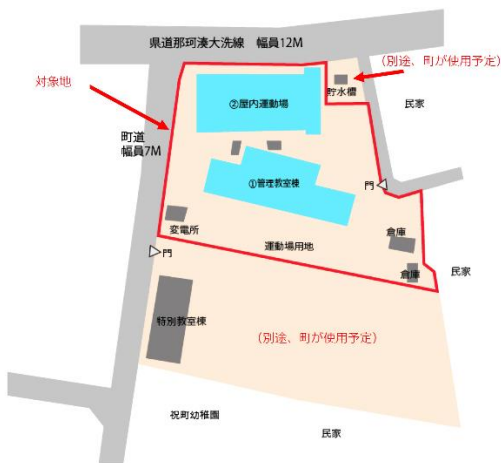
【旧祝町小学校配置図】