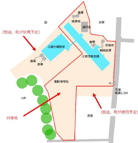
【旧大貫小学校配置図】