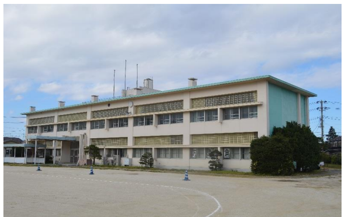
【旧祝町小学校校舎】