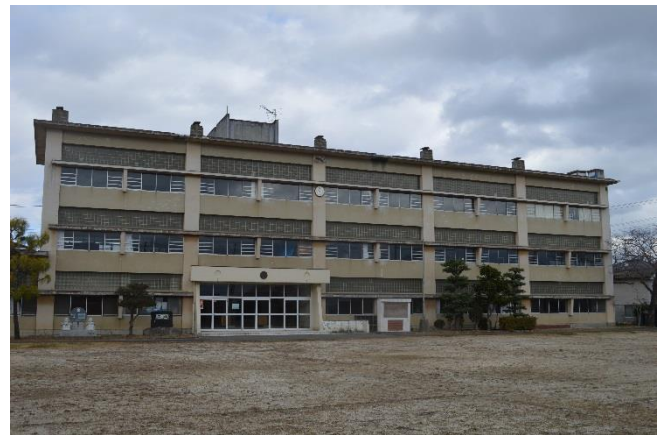
【旧夏海小学校校舎】