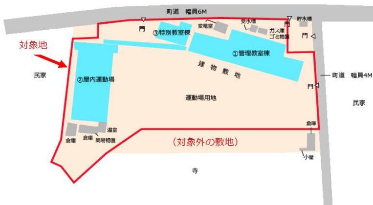
【旧夏海小学校配置図】