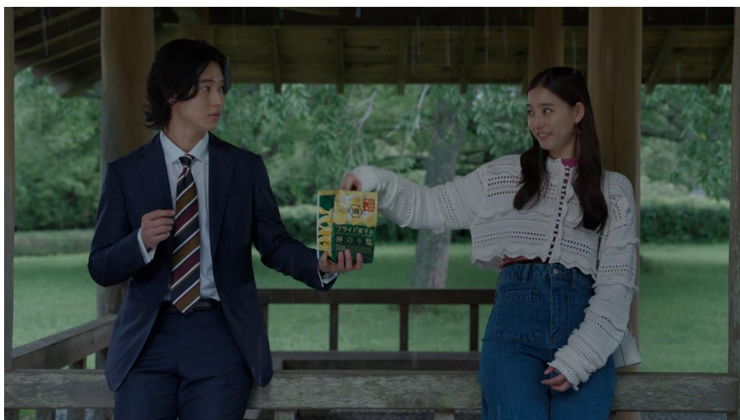
「食べます？」篇 (15 秒)