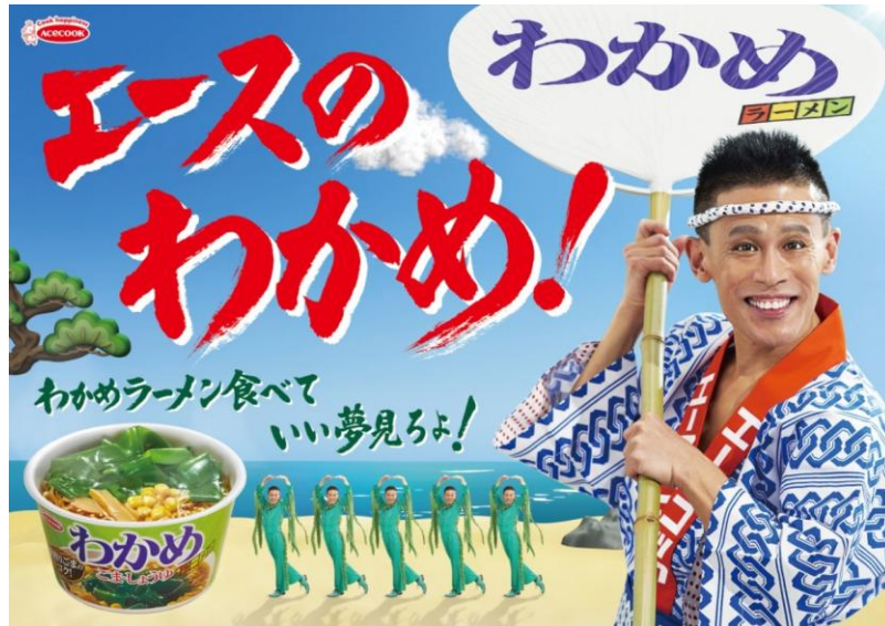
わかめラーメン ごま・しょうゆ/ごま・しお 三島のゆかり仕立て/ピリ辛みそ