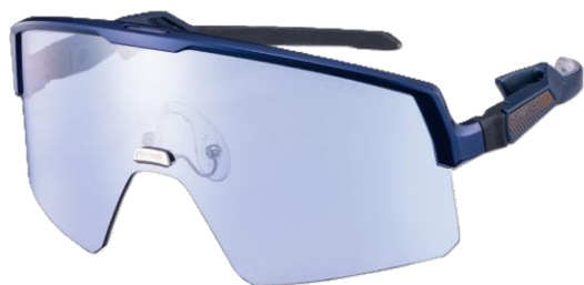
中村 心 選手着用モデル