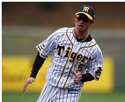
FACEONEを着用する近本光司選手