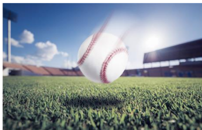
ULTRA LENS あり