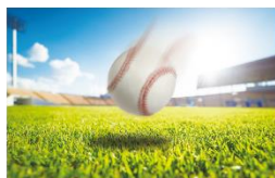
ULTRA LENS なし

フライ捕球のため上空を見上げる、日陰の地面を這うゴロを処理する、逆光の中、投手から放たれるボールを打撃するなど、野球における様々なシチュエーションで利用できるレンズを求め、サポート選手への徹底的なヒアリングをおこなった結果、