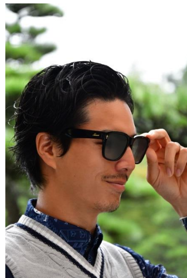
着用モデル : SWCG-002M BK

品番 : SWCG-002M カラー : CRD フレーム : クリアレッドデミ レンズ : シルバーミラー×スモーク(裏面マルチ) 価格 : ¥23,000 (税別)