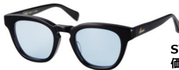
SWCG-001 (ラウンドタイプ) 全4色 価格：¥22,000～23,000 (税別)