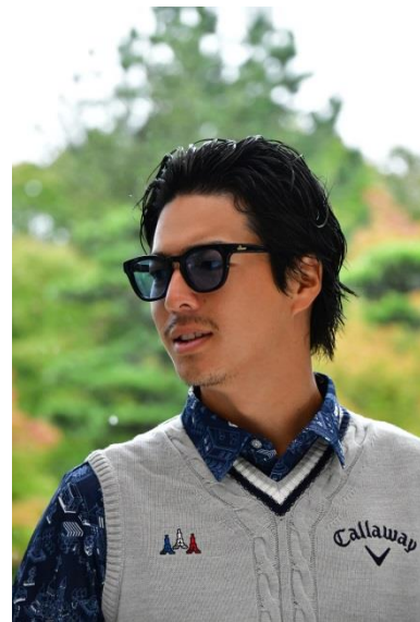
着用モデル : SWCG-001N BK

品番 : SWCG-001N カラー : DB フレーム : デミブルー レンズ : ライトブルー(裏面マルチ) 価格 : ¥22,000 (税別)