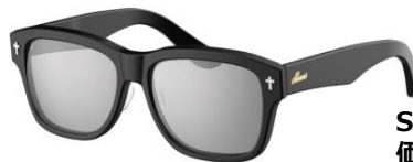
SWCG-002 (スクエアタイプ) 全4色 価格：¥23,000 (税別)