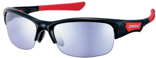
SPRINGBOK (スプリングボック) SPB-0714 BK

勝みなみプロは、高校1年生の時に「KKT杯バンテリンレディスオープン」で、アマチュアながら女子プロツアー史上最年少優勝（15歳293日）という快挙を成し遂げ、日本ゴルフ界の歴史を塗り替えた業界きっての注目選手です。株式会社明治安田生命に所属しており、2018年にはプロゴルファーとして本格レギュラー参戦し、大王製紙エリエールレディスオープンでツアー通算2勝目、プロ初優勝を挙げています。