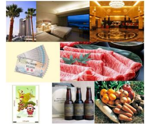
※商品はイメージです。