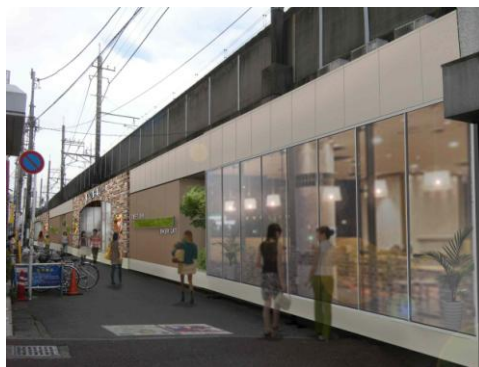
※外装はイメージです。

「私のお気に入りの風景」をコンセプトに、どこか懐かしい稲毛の街の風景や歴史が感じられるレンガ造りのアーチを5箇所のエントランスに施し、街の顔としての外観が大きく変わります。