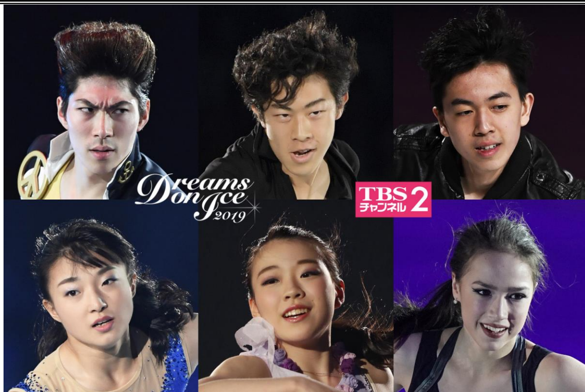
(上段左から) 田中刑事、ネイサン・チェン、ビンセント・ジョウ (下段左から) 坂本花織、紀平梨花、アリーナ・ザギトワ

CS放送「TBSチャンネル2 名作ドラマ・スポーツ・アニメ」では、6月28日(金)から30日(日)まで、神奈川県横浜市のKOSÉ新横浜スケートセンターで開催されるフィギュアスケート日本代表エキシビション『Dreams on Ice 2019』全4公演のうち、30日(日)昼公演の様子を独占生中継する。