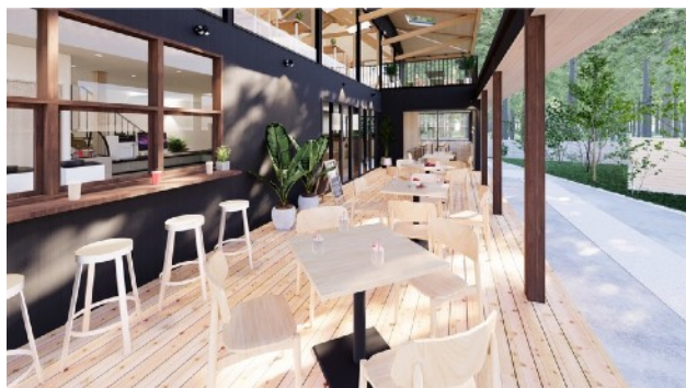
1階テラス席の様子