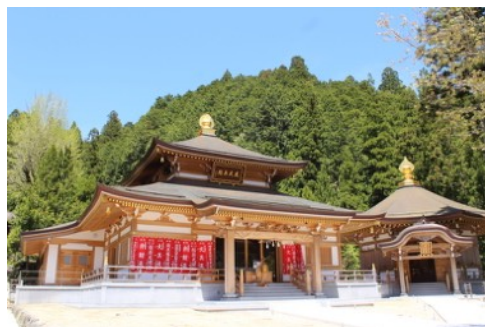
清浄心院さんの護摩堂と永代供養堂