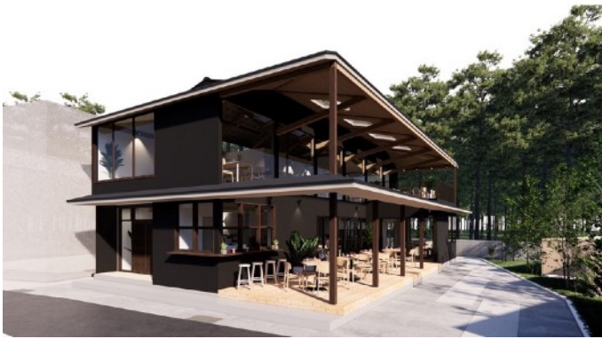
建設予定の「天風TERRACE」外観

公式ページ: https://motion-gallery.net/projects/temp Terrace