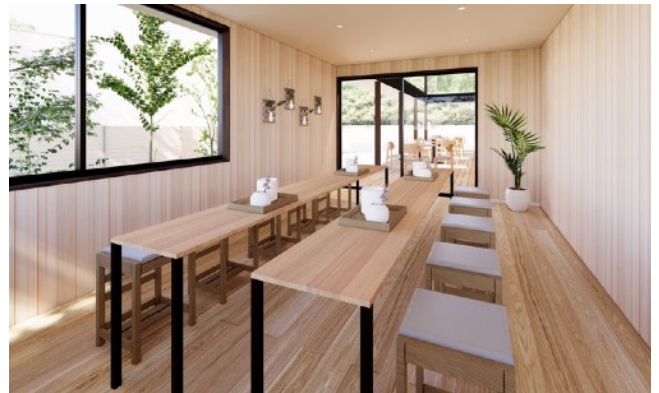
1階に設けたワークスペース