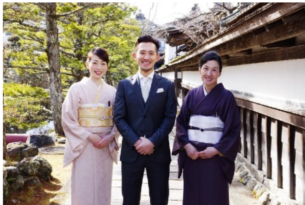
若女将（左）、社長（中央）、会長（右）

観光業に携わる私たちには大変厳しいコロナ禍はまだ続いています。また私たちだけではなく、お取引様、お土産のメーカー様、地域の農家さんなど、関係する全ての方にも大打撃がありました。「天風TERRACE」は、高野山や高野山麓の魅力を体感できるアンテナショップとして訪れる人と地域の人・文化を繋ぎ、関わる全ての人たちと一緒に高野山・高野山麓を含めた地域全体を盛り上げるランドマークのような存在になりたいと思い立ち上げたプロジェクトです。1人でも多くの方に高野山のファンになっていただけますように。皆様、ご支援のほどどうぞ宜しくお願い申し上げます。