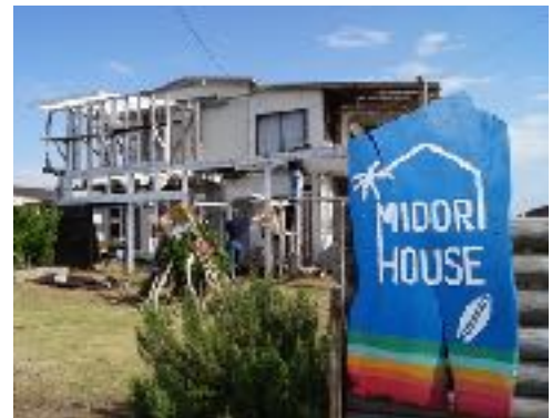
舞台となるビーチハウス