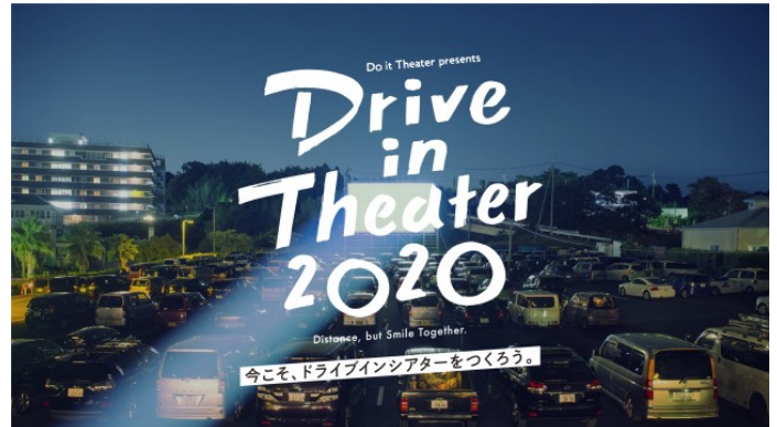
「Drive in Theater 2020」ビジュアル

多様な文化を育んできたミニシアターを、未来へとつなぐ。ミニシアター・エイド（Mini-Theater AID）基金本日開始の「ミニシアター・エイド基金」は、新型コロナウイルスの感染拡大による緊急事態宣言、政府からの自粛要請が続き、全国の小規模映画館「ミニシアター」が閉館の危機にさらされる状況下で、深田晃司監督・濱口竜介監督が发起人となり、MOTION GALLERY代表・大高健志など有志メンバーで立ち上げる基金です。ミニシアターは、経営は小規模ですが、「多様性」という観点から見て日本文化への貢献度は非常に大きなものです。現時点で、全国のミニシアター67劇場以上の参加希望、多くの映画監督からの賛同と参加の意思表示があり、署名活動を通じて政府への提言を進める「SAVE the CINEMA ( https://bit.ly/2ye021S )」と連携する取り組みです。 https://motion-gallery.net/projects/minitheateraid