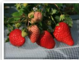
④ミツバチが花粉媒介（ポリネーション）をしてから、約45日で収穫します。