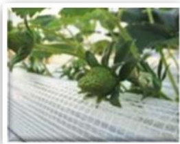
③花托（花床）がふくらんで実ができます。