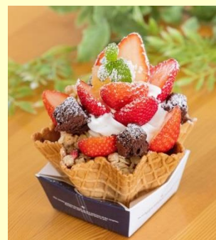
▲「農園完熟いちごパフェ」 税込 870円

また、食べごろのイチゴをパックに詰めた「いちごパック」（約 300g、8～16粒入、税込 1,100円）は、12月から販売しています。