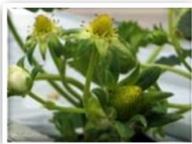
②イチゴの雄しべが黒くなり、花びらが自然に落ちます。