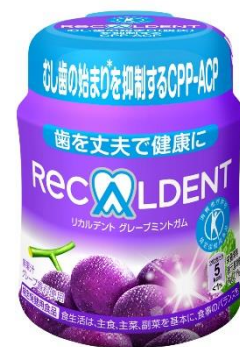
リカルデント グレープミントガム ボトル R

※2 歯科保健の発展・普及に寄与するとともに、安心・安全に使用できる歯科衛生製品として推薦された商品です。