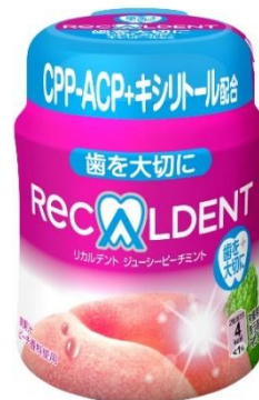
リカルデント ジューシーピーチミント ボトル R