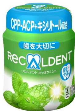
リカルデント さっぱりミント ボトル R