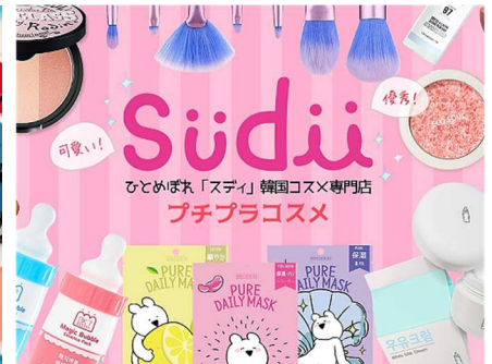
話題の韓国コスメ専門店。手に取って比べられ、プチプラコスメで人気「スティ」