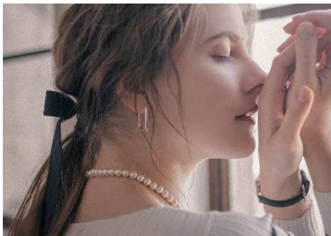
大人っぽく落ち着いた感のある内装で、他の「アネモネ」よりも幅広い商品ラインナップ「アネモネ」

さらに、天王寺・阿倍野エリアは珍しい本格的なスパイスカレーが味わえる専門店「 ポンガラカレー 」や、鮮度にこだわった産地直送の新鮮な魚介の握り寿司を気軽にテイクアウトいただける「 大起水産 街のみなと 」が登場し、天王寺にお越しのお客様が気取らず、気軽にお楽しみいただけるような施設を目指しリニューアルいたします。