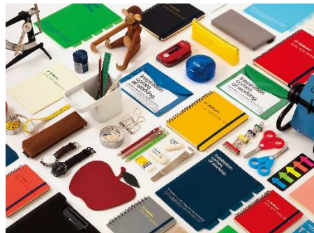
国内外から機能的でデザイン性に優れた商品を厳選した、文具・雑貨のセレクトショップ「スミス」