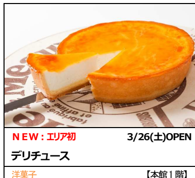
NEW：エリア初 3/26(土) OPEN デリチユース 洋菓子 【本館 1 階】