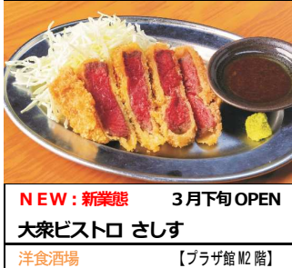
NEW：新業態 3月下旬 OPEN 大衆ビストロ さしす 洋食酒場 【プラザ館 M2 階】

開業以来盛況が続くプラザ館 M2 階「エキラエスタンド」を拡張し、コスパの高い繁盛店や人気店の新業態を導入。“キタ”で屈指の繁盛店である「すし酒場 さしす」が手掛ける新業態の洋食酒場「大衆ビストロ さしす」や、独自ルートで仕入れた鮮度の高い海鮮と、揚げたてサクサクの天ぷらをリーズナブルに楽しめる「旨い海鮮と揚げたて天ぷら ニューツルマツ」、圧倒的なコスパで気軽に焼肉を楽しめる“キタ”の繁盛店「大衆 焼肉ホルモン 大松」など、価格以上のクオリティを提供する人気店が勢揃い。さらに本館 10 階には、昭和 13 年の創業当時から受け継がれる「漆黒のスープ」が代名詞の京都ラーメンの源流「新福菜館」がエリア初出店いたします。肉の旨味が凝縮され、見た目には反してコク深くあっさりとしたスープは必食。駅直結でお気軽にお立ち寄りいただける場所に、味自慢の名店・人気店が続々登場いたします。