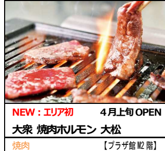
NEW：エリア初 4月上旬 OPEN 大衆 焼肉ホルモン 大松 焼肉 【プラザ館 M2 階】