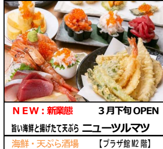
NEW：新業態 3月下旬 OPEN 旨い海鮮と揚げたて天ぷら ニューツルマツ 海鮮・天ぷら酒場 【プラザ館 M2 階】