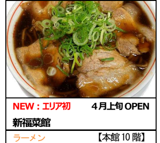
NEW：エリア初 4月上旬 OPEN 新福菜館 ラーメン 【本館 10 階】