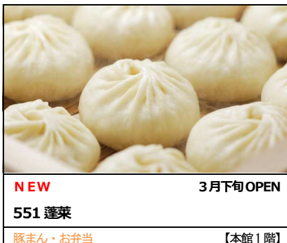
NEW 3月下旬 OPEN 551 蓬莱 豚まん・お弁当 【本館 1 階】

近隣・近郊にお住まいのお客様の食卓を豊かに彩る惣菜・スイーツの人気店を、改札直結の両館 1 階に集積。「ある時〜！」は家族みんなが笑顔になる豚まんの名店「551 蓬莱」が、JR 天王寺駅東改札口出てすぐの本館 1 階に新登場するほか、チーズの王様と言われる「フリー・ド・モー」を使用したチーズケーキが看板商品の大阪箕面発の人気洋菓子店「デリチユース」がエリア初出店。さらに子供から大人まで幅広い年代に愛されるドーナツの定番ショップ「ミスタードーナツ」が天王寺ミオにカムバック。大切なご家族やご友人への手土産に、頑張った自分へのご褒美にぜひご利用ください。