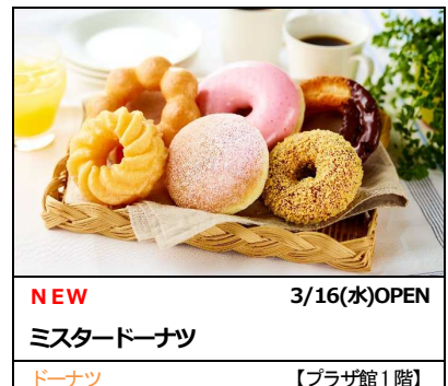
NEW 3/16(水) OPEN ミスタードーナツ ドーナツ 【プラザ館 1 階】

天王寺ミオは 2022 年春も、皆さまにワクワクしながらお買い物、お食事をお楽しみいただけるスポットとしてパワーアップいたします。進化する天王寺ミオにどうぞご期待ください。