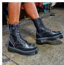
ドクター・マーチン 【本館2F】