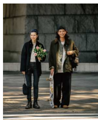
フリークスストア 【プラザ館2F】