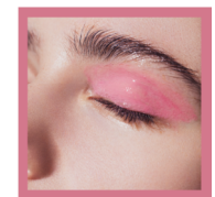
Make Up Kitchen Organic Natural Beauty

【ショップホームページ】 http://www.makeup-kitchen.com/