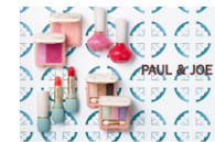
PAUL & JOE

【ショップホームページ】 http://www.paul-joe-beaute.com/jp/