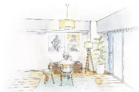
仲間と繋がり運動を楽しめるリビング