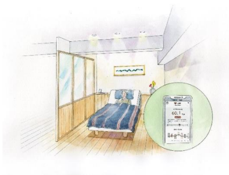
睡眠の質に配慮した寝室

長く健康でいられるように、時間の経過と共に変化していく心身の状態や暮らしに合わせ、お客さまごとの趣味嗜好や心身の状態をヒアリングし、オーダーメイド設備機器の設計やプランニングを PB 監修のもとマイリノが行います。例えば、将来的に車椅子などのサポート機器を利用することも想定し、機器を利用される場合も安心して好きな料理を楽しんでいただける造作キッチンをご提案したり、身体の変化に合わせて手摺などのサポート機器の高さを調整できるなど、将来の変化にも対応できるようなご提案をします。お客さまごとの趣味嗜好や心身の状態に合わせて自分らしい暮らし方が可能です。