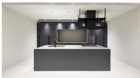
憧れを凝縮したキッチンスタジオ

※3 中古マンション探しからリノベーションまでワンストップで提供する事業者のマンションリノベーションに特化したショールームとしては関西最大級。当社調べ。