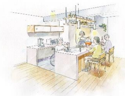
車椅子でも料理を楽しめるキッチン