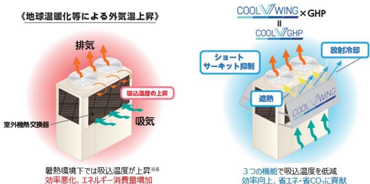
図1 COOL WING の機能

大阪ガス、Daigas エナジー、ヤンマーES、SPACECOOL 社は、「COOL WING」の普及を通じて、より多くのお客さまの暑熱環境を改善するとともに、社会課題であるカーボンニュートラル社会の実現に貢献してまいります。