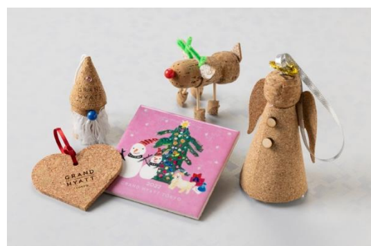
チャリティーコルクアイテム

※内容ならびに価格に変更する場合がございますので、ご掲載いただく際は事前にお問い合わせください。