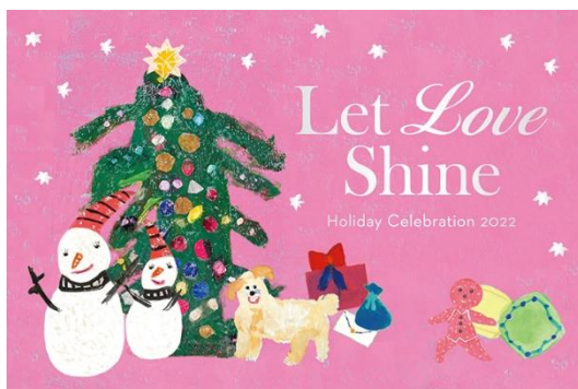
チャリティーメインビジュアル