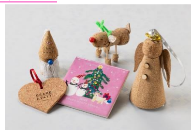
オーナメントイメージ

レストランやホテルで消費されたワインやシャンパンのコルク栓を障がい者の方たちが再利用して作るトナカイやサンタクロース、天使の形をしたオーナメントと 2011 年からスタートした子どもたちが描く絵をモチーフにしたタイルを数量限定でご用意いたします。福祉施設で働く障がい者の方々が一つひとつ丹念に作り上げたオーナメントは、心のこもったクリスマスプレゼントに最適です。売上のすべてを子供地球基金に寄付します。