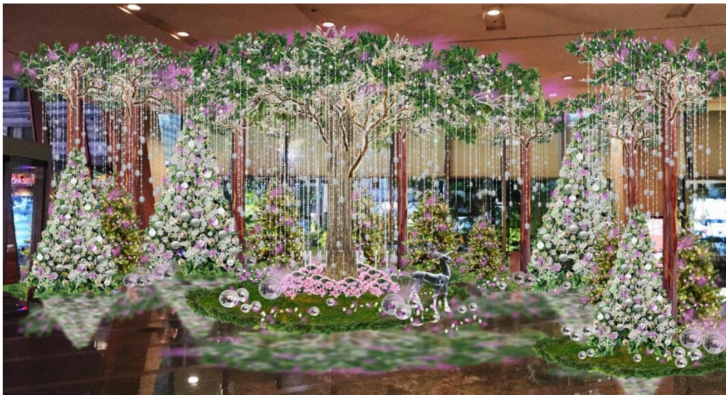
ロビーエリアのクリスマス デコレーション(イメージ)

今年のテーマは“Let Love Shine”「ホリデーシーズンには、愛する気持ちや思いやりの心を大切な人たちと分かち合い、世界中にその輝きが届き愛に包まれますように」との思いを込めました。ホテルで廃棄されるはずだったワインコルクを再生利用してつくったクリスマスオーナメント入りのチャリティーハンパーは、贈り物に最適です。ロビーのクリスマスエリアには、今年のテーマに合わせ、ピンクを主役にしたデコレーションが登場いたします。また、写真をInstagramに投稿いただくことで参加できるチャリティープログラムも実施予定。毎年よりたくさんの人々に「愛」という無償の贈り物が届きますように。