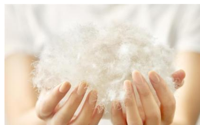
ピローに詰められた羽毛のイメージ