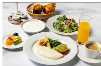
ヘルシーブレイクファスト (美容とウェルネスを意識したメニュー)