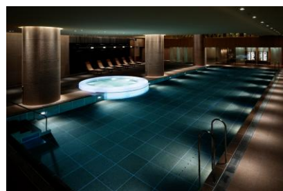
Nagomi スパ アンド フィットネス プール