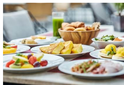
ブレイクファスト ビュッフェ ※イメージ (六本木のラグジュアリーホテルで味わう朝食)