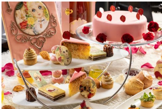
『ベルサイユのばら』アフタヌーンティー(イメージ)