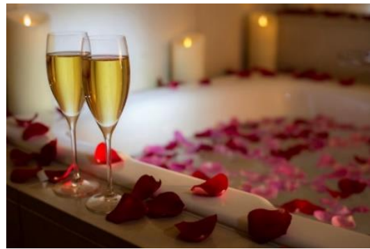
ローズバスとシャンパン(イメージ)