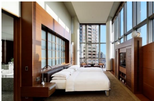
260㎡の「プレジデンシャル スイート」