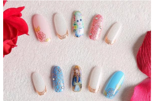
『ベルサイユのばら』ダイヤモンド付きネイル

都会の喧騒にそびえ立つダイナミックなラグジュアリーホテル、グランド ハイアット 東京(東京都港区、総支配人:ロス クーパー)では、2022年9月17日(土)～11月20日(日)の期間、ホテルが位置する六本木ヒルズ内の展望台「東京シティビュー」(六本木ヒルズ森タワー52階)にて開催される「誕生50周年記念 ベルサイユのばら展ーベルばらは永遠にー」(以下「ベルばら展」)に合わせ、不朽の名作“ベルサイユのばら(以下『ベルばら』)”をテーマにしたステイプランをご用意いたします。