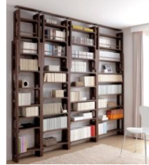
↑奥行17cmタイプ ダークブラウン