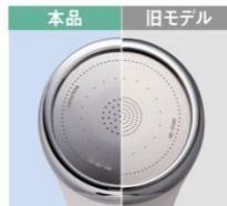
dinosオリジナル 散水板(共通)