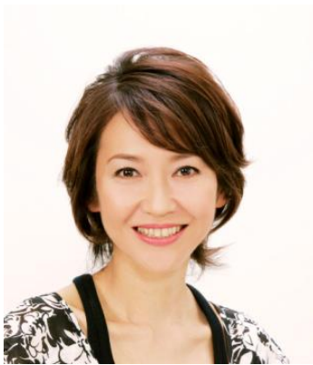
審査員 賀来千香子さん／女優

雑誌『JJ』などでモデルとして活躍。 1982年、『白き牡丹に』で女優デビュー。 以後ヒットドラマに数々出演し、舞台、映画、CMでも活躍中