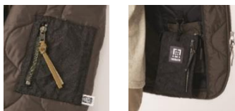
(左) 袖ポケットもエアバッグ素材 (右) エアバッグ素材のサコッシュバッグ (別売/次頁掲載) を内側に取付可能

このたび、「リバースプロジェクト」とメンズファッションブランド「ディノスコード」との初のコラボレーションが実現。技術の発達により染色ができるようになったエアバッグを黒に染めた再生素材や、一度商品化されたものを繊維に戻すことで作られるリサイクルポリエステル素材を使用したサスティナブルな“中綿キルティングブルゾン”を新発売します。