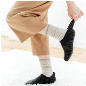
上・着用画像はイメージです