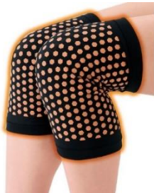
上・着用画像はイメージです 実際の着用はプリント面が 内側になります