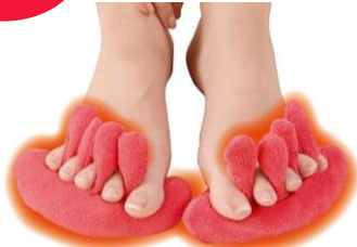
上・着用画像はイメージです