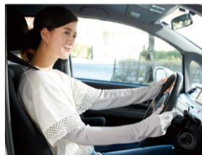
■放熱吸汗 ムレにくいUVアームカバー (1双) <美活計画> (品番：YF-1775) 1,980円 (税抜)

息が通りムレにくい、Cゾーンまでカバー 日焼けによるシミがしやすいCゾーン(写真①)までしっかりカバーし、下部が開いているため(同②)息が通るデザイン。一般的なマスクの形状の延長上の「わかこも」ではないデザインが魅力。