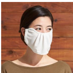
■放熱吸汗 ムレにくいUVマスク (同色2枚組) <美活計画> (品番：YF-1776) 1,980円 (税抜)

(※1)ユニチカカーメンテック(株)調べ、室温20度、湿度65%の室内で、発汗装置を生地接触設置し、表面温度が一定した5分後で風速約3m/秒の微風を当て続け、表面温度の変化を計測