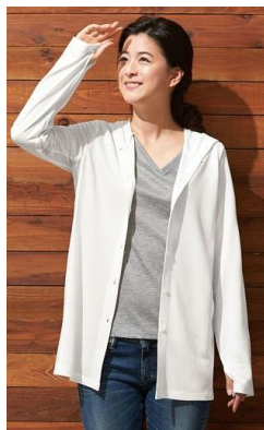
■放熱吸汗 首までカバーする UVパーカー<美活計画> (品番：YF-1774) M～L 2,990円、LL～3L 3,290円 (税抜)