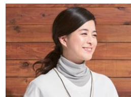
■放熱吸汗 付け襟風UVネックカバー <美活計画> (品番：YF-1787) 1,980円 (税抜)

二の腕までカバーするロング丈。腕の内側に通気口があり風を通しムレにくい。また、はき口は内側のみゴムを付かず、くい込みを押さええます。さらに内側に指先スリット付き。