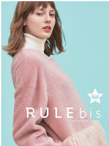
「RULE bis」2019 冬号 カタログ表紙

株式会社ディノス・セシール（本社：東京都中野区）は、「ディノス」で展開する、カラフルな色使いや遊び心が満載のアイキャッチなファッションブランド「RULE bis（ルール ビス）」の2019冬コレクションを、ディノスオンラインショップ上の専用サイト（ https://www.dinos.co.jp/rulebis/ ）にて、2019年11月28日に発売します。