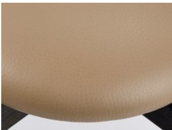
丁寧になめされた、しなやかで美しいレザー座面

北海道の広大な大地と寒暖差が育む、きめ細やかで上質な皮を北海道・旭川の作田畜産で丁寧に原皮へと加工。その後、原皮は姫路の川善商店の高いなめし技術によって、日本の風土にあったハイクオリティな「北海道レザー」へと仕上げられています。また、食肉の副産物であり、アップサイクル素材である天然皮革を無駄なく活用し、地産地消していくことはサステナブルな社会への貢献にもつながります。