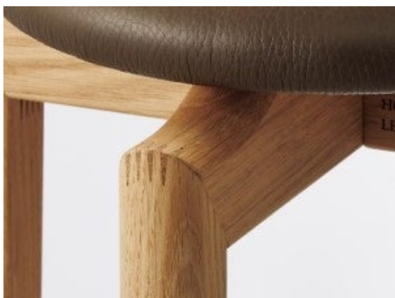
脚部のフィンガージョイント

日本有数の家具産地である北海道・旭川で1979年の創業以来、木製家具づくりを手掛けてきました。“つくっているのは、心地です”を合言葉に、家具づくりの先にある座り心地、触り心地、使い心地などをなによりも大切に、現代の暮らしを楽しく美しくする家具を、日本伝統の木工技術を生かした職人の手仕事でつくりあげています。