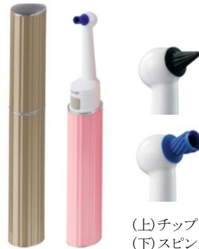
(上)チップ (歯間・歯周ポケット用) (下)スピuncup(歯面用)