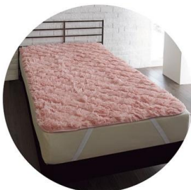
ラビット調 パッドシート (シングル)