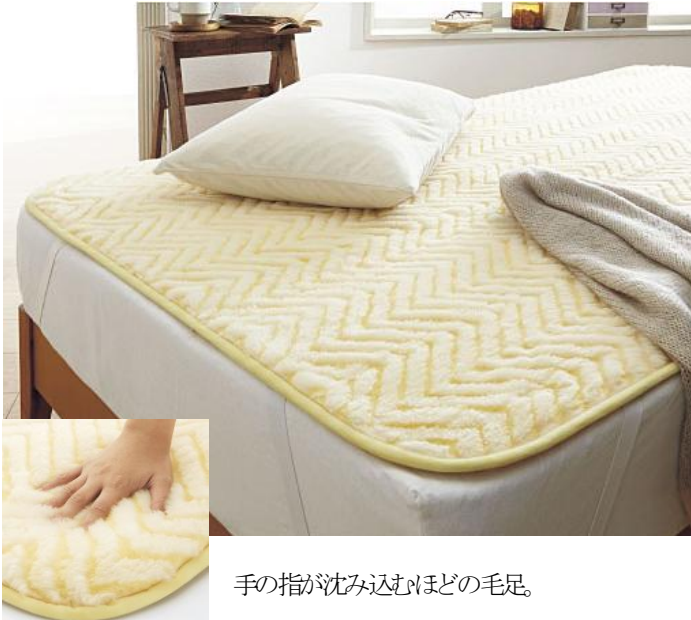
手の指が沈み込むほどの毛足。

「メリノウール」と「発熱繊維」を組み合わせ、二重の暖かさを実現した敷きパッド ~天然素材のメリノウールをメインに、あたたかさと、快適な睡眠環境を追求~