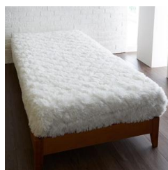
ラビット調 パッド一体型 ベッドシート (シングル)