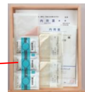
中間サイズの引き出しには、大きめの薬を収納