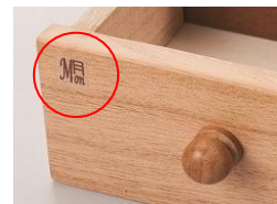
曜日と時間(朝・昼・夜・寝)の分類シール付き