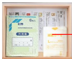
いちばん大きな引き出しは、処方箋やメモなどの書類を