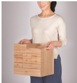
左右に持ち手付き

軽くて防湿性に優れ、薬の保管に最適な桐材を使用。様々な処方箋をはじめ、体温計、メガネ、はさみ、ティッシュケースなどを仕分けして収納できるように仕切りを工夫。種類が多い処方薬を、曜日と時間帯で整理できるので便利です。左右に持ち手が付いているので、移動もラクにできます。