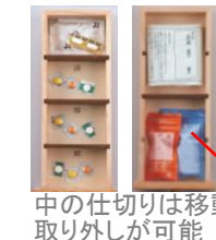
中の仕切りは移動・取り外しが可能