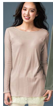
■レース使いプルオーバー