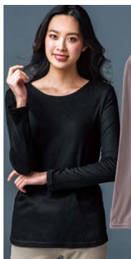
■クルーネックプルオーバー