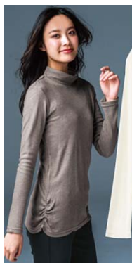
■ハイネックプルオーバー