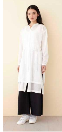
■ヘリンボーン シャツ ドレス 税抜価格…17,800 円