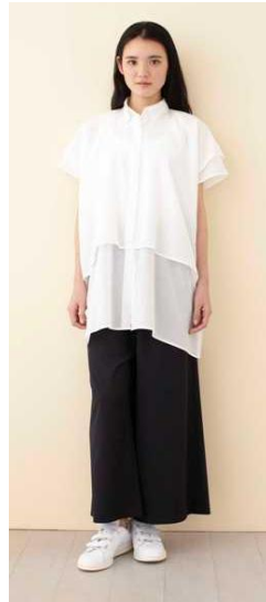
■ライトローン スクエア シャツ 税抜価格…13,800 円