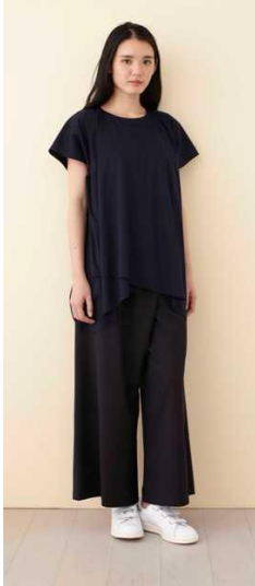
■ハイゲージ スムース ドレープ トップス 税抜価格…9,800 円