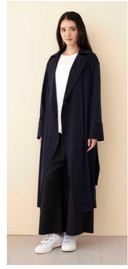
■ハイゲージ スムース コート 税抜価格…23,800 円