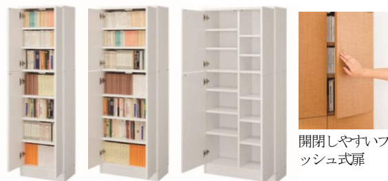
開閉しやすい ツッシュ式扉

写真左から、幅45cm、60cm、75cmの3タイプ。 奥行きは20cm、32cmの2タイプから選べます。