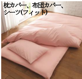
枕カバー、布団カバー、シーツ(フィット)

「天然コットンは好きだけど、乾きにくいし、重くて干すのが大変」など、お客様の悩みにお応えするための寝具カバーシリーズ。繊維の表面に特殊加工を施した綿素材「リコットン」は、水分を必要以上に吸収しないので、通常綿(未加工品)に比べて、生地が濡れた時の重さや乾燥時間は約 1/2 です。風合いや吸湿性の綿の魅力はそのままに、洗濯はラクにできるのがお勧めです。