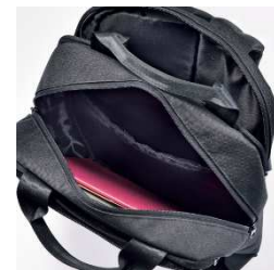
<リュック内側イメージ>