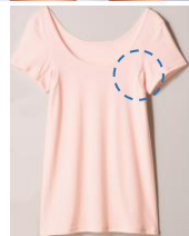
汗取りパッド付インナーフレンチ袖