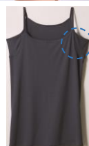
汗取りパッド付ハイバックキャミソール