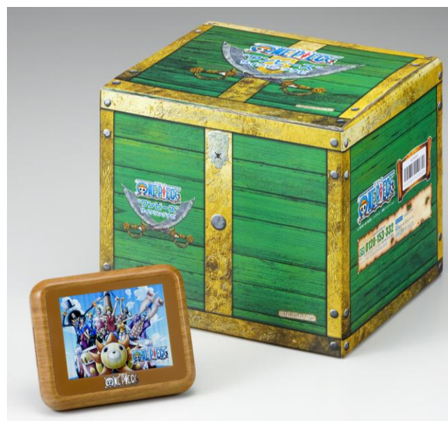
《パッケージと本体(画面は起動画面)》